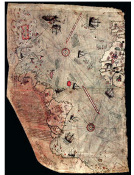
Sopra: l'"impossibile" mappa di Piri Reis (XVI sec.). Fu forse realizzata dagli abitanti di Agharti?

Ho appena avuto un incontro di Stato Maggiore al Pentagono. Ho riportato interamente la mia scoperta ed il messaggio del Maestro. E' stato tutto doverosamente registrato. Il Presidente ne è stato messo al corrente. Vengo trattenuto per diverse ore (6 ore e 39 minuti per l'esattezza). Sono accuratamente interrogato dal Top Security Forces e da una équipe medica. È UN TRAVAGLIO!!!